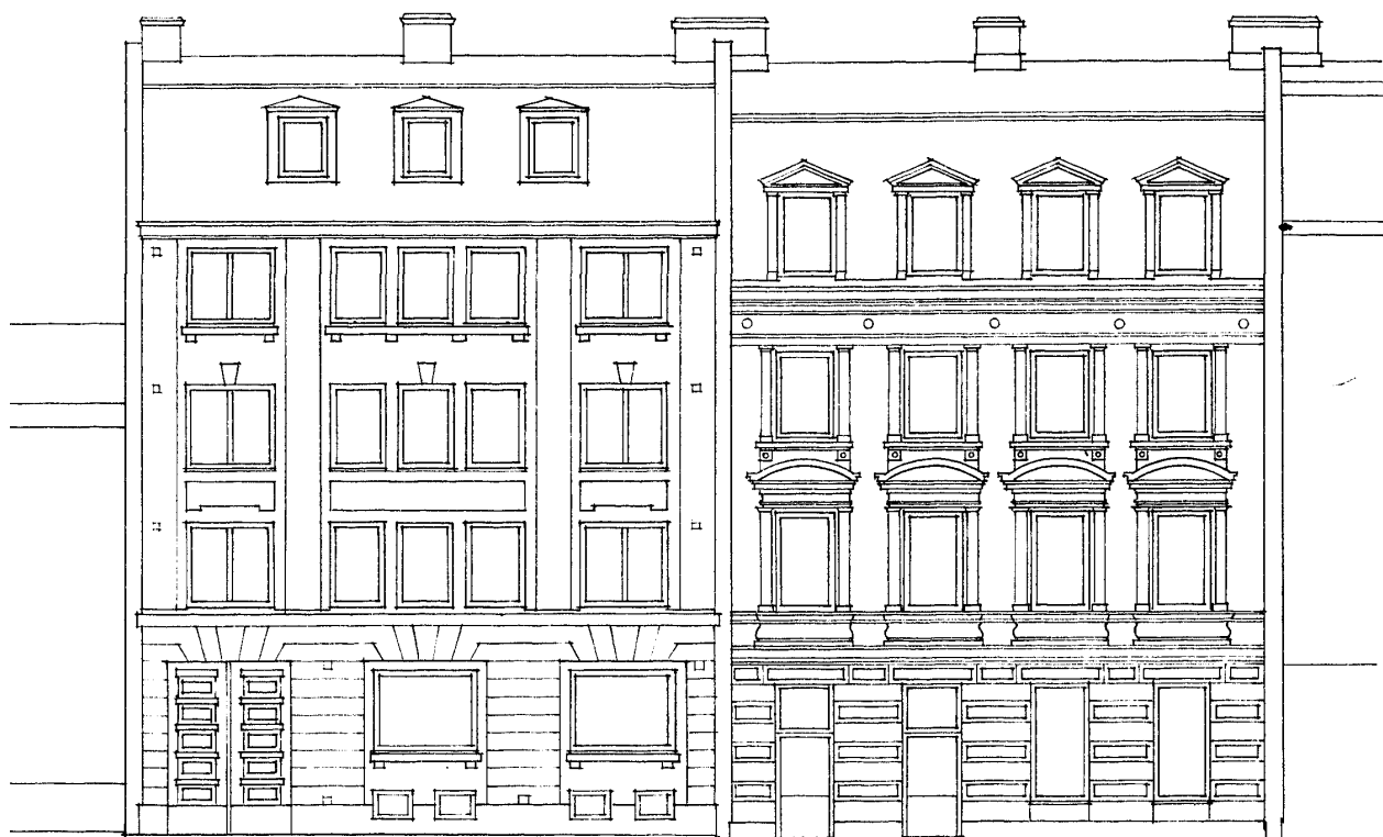
FASAD MOT SÖDER/KYRKOGATAN

Stadgar för Bostadsrättsföreningen Kyrkogatan i Göteborg, Göteborgs kommun, organisationsnummer 769609-6366